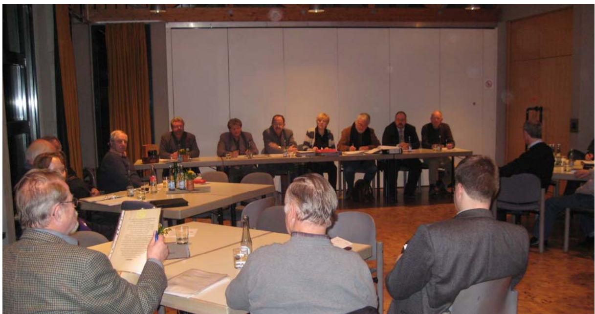
Rege Teilnahme fand die diesjährige Jahreshauptversammlung des Hohenlimburger Städtepartnerschaftsvereins „HoLiBru“ im Gemeindesaal der Ev. Ref. Kirche

*(für das 50-jährige Städtepartnerschafts-Jubiläum – Anm. HoLiBru)